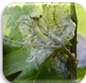
Tache de Mildiou en cours de sporulation

A Linguizetta : le 11 juin, faible attaque sur feuilles de Niellucciu (1% des feuilles touchées).