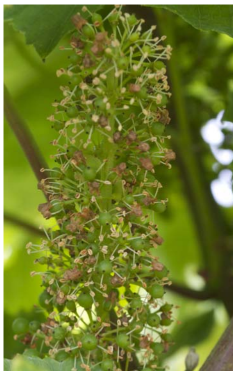
Stade J Nouaison