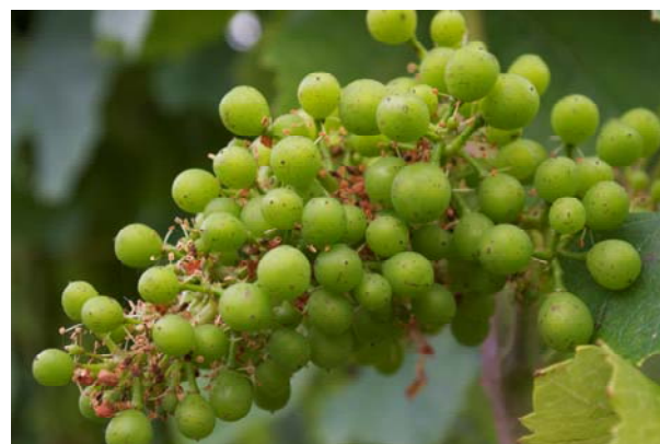
Stade K Petit pois