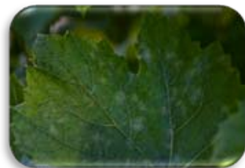
Oïdium sur feuille