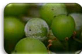
Oïdium sur grappe