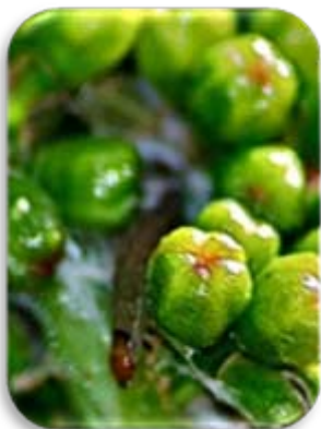
Eudemis dans glomérule

Le vol de deuxième génération est actuellement en cours sur l'île.