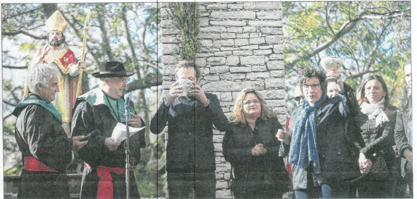
Pour fêter le vin nouveau, la confrérie des vignerons de Patrimoniu avait choisi de se placer sous le parrainage du critique gastronomique François-Régis Gaudry et des scientifiques du Centre de recherche viticole de Corse.

Près de deux mille personnes étaient réunies hier à Patrimoniu pour assister à la fête organisée par les vignerons. Des célébrations marquées par la présence d'invités de renom, à la mesure des ambitions du vignoble