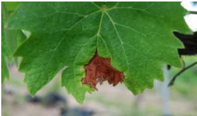
Botrytis cinerea sur feuille

Des symptômes sur inflorescences nous sont également rapportés en Balagne (Montegrosso, Lumio, Calenzana) sur Grenache et Carcaghjolu, mais les parties atteintes sont en cours de dessèchement.