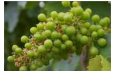
Stade K : Petit pois