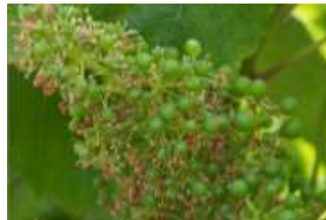
Stade J : Nouaison