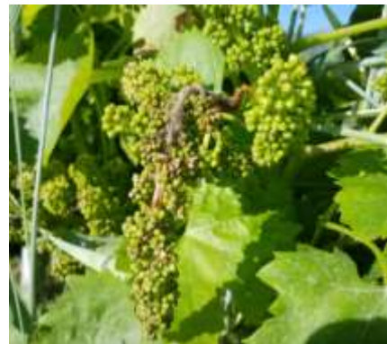
Botrytis cinerea sur inflorescence