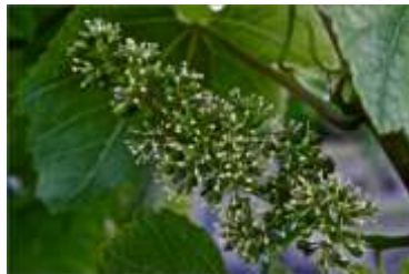
Stade I : Floraison

La vigne présente un retard de quelques jours par rapport à 2017. Les cépages Niellucciu, Biancu gentile, Grenache commencent dans certaines situations à atteindre le stade petit pois. La floraison et la nouaison sont en cours dans la majorité des cas.