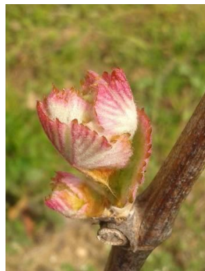
Stade D « sortie des feuilles »

La majorité des parcelles ont atteint le stade E de Baggiolini « 2-3 feuilles étalées ». Les parcelles les plus tardives se situent entre le stade C « pointe verte » et le stade D « sortie des feuilles », et enfin pour les plus précoces, le stade F est atteint « grappes visibles ». Il semblerait que la végétation ait environ 7 à 10 jours de retard par rapport à l'année précédente.