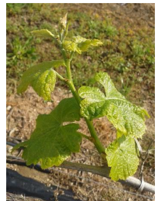
Stade F « grappes visibles »