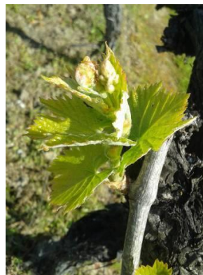
Stade E « 2-3 feuilles étalées »