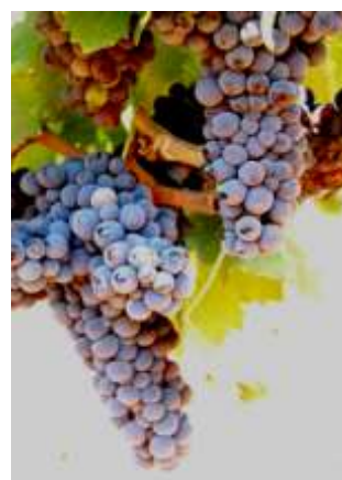
Pleine véraison (stade M)