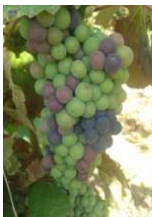
Mi-véraison (stade M)