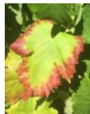
Dégât de cicadelle verte sur Niellucci

Evaluation du risque : Elevé à cette époque de l'année. Attention aux attaques importantes qui pourraient impacter sur la maturation des baies.