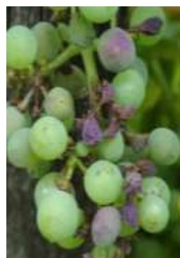
Rot brun sur grappe