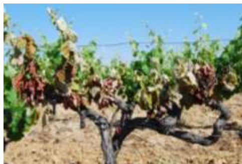
Apoplexie d'un cep (3 jours)