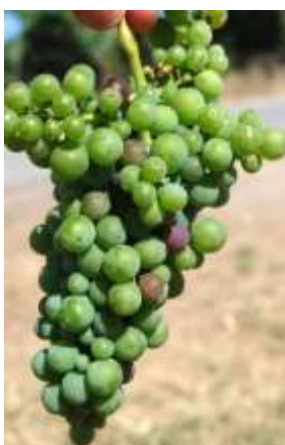
Début véraison (stade M)

La phénologie reflète actuellement une avance d'environ une semaine par rapport au millésime 2016. Cependant, de l'avis des observateurs, il n'est pas certain que cette avance se maintienne, surtout en cas de forts rendements et si les conditions météorologiques du moment persistent (absence de précipitations, risque de ralentissement voire blocage de maturité).