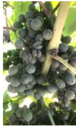
Eclatements de baies suite à une contamination par l'oïdium

Gestion du risque : Les attaques d'oïdium peuvent entraîner l'apparition de pourriture grise ou acide.