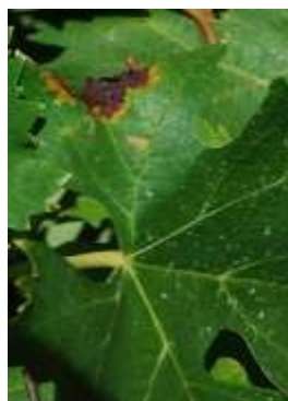
Tache d'huile face supérieure évoluant en nécrose