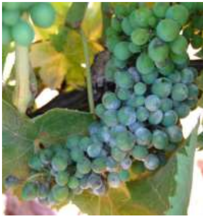
Poussière grise d'aspect cendré sur baie