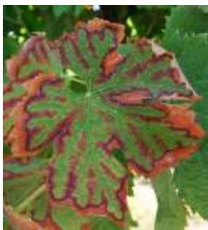
Symptômes foliaires de BDA