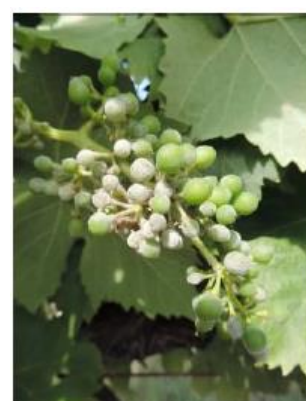
Symptômes d'oïdium sur grappe

Évaluation du risque : La vigne se trouve, jusqu'à fermeture de la grappe, dans une période de forte sensibilité au champignon.