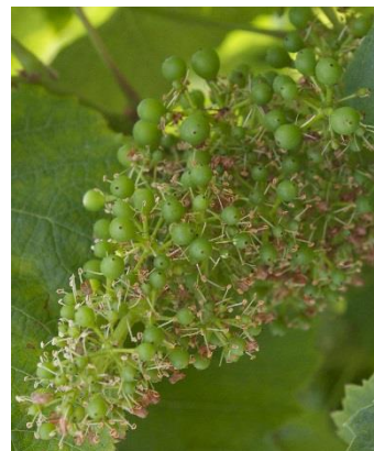
Grain de plomb