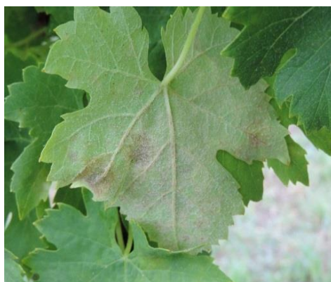
Symptômes d'oïdium faces supérieure et inférieure